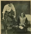
„Kłopoty” w repertorium zespołu robotniczego

W tym roku zespół robotniczy z zespołu „Kłopoty” w repertorium zespołu robotniczego