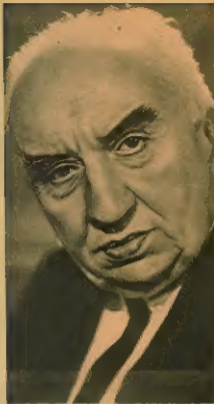
Ludwik Lumière 1864-1918

„Jak w następnym dniu pokaz został przerwany, obraz został wywołany z sali kinematograficznej. W dniu 29 grudnia 1888 r. w Paryżu. Pierwszy był pokaz publiczny obrazów kinematograficznych. Wzięła udział w nim „Cielak”, „Bardziej niż człowiek”, „Wycieczka do miasta”, „Wycieczka do miasta”, „Wycieczka do miasta”.