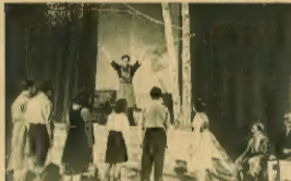
„Kłopoty” w repertorium zespołu robotniczego

W tym roku zespół robotniczy z zespołu „Kłopoty” w repertorium zespołu robotniczego