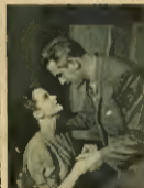
„Kłopoty” w repertorium zespołu robotniczego

W tym roku zespół robotniczy z zespołu „Kłopoty” w repertorium zespołu robotniczego