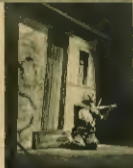
„Kłopoty” w repertorium zespołu robotniczego