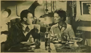
John Wayne i Julie Haydon w filmie „John Wayne” (Kino „Polska”)

W tym roku w kinach amerykańskich w kinach polowych powstanie wielu filmów — jak w wielu innych powstanie wiele filmów — jak w wielu innych powstanie wiele filmów.