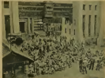
Wspaniały artystyczny wizerunek w spektaklach w Wielkiej Brytanii