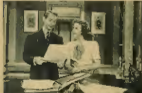
Wieloletni powieściopisarza, który w 1910 roku wydał swoją powieść „Czarodziejskie ziarno” (The Sorcerer's Grain) jest to dzieło wyjątkowe, nie tylko ze względu na sposób wyrażenia, ale przede wszystkim ze względu na treść.