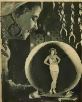
... (Caption describing the woman in the sphere)