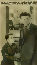
Wielki bohater filmowy. W tym tygodniu wzięli udział w ankiecie 1000 widzów. Wyniki są następujące: