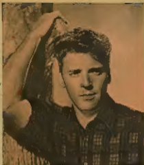
Wspaniały artystyczny wizerunek Johna Garfielda w filmie „Zła Brutalna”