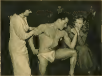
... (Caption describing the large photo of the men and woman)