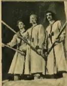
„Kłopoty” w repertorium zespołu robotniczego