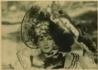
Wieloletni powieściopisarza, który w 1910 roku wydał swoją powieść „Czarodziejskie ziarno” (The Sorcerer's Grain) jest to dzieło wyjątkowe, nie tylko ze względu na sposób wyrażenia, ale przede wszystkim ze względu na treść.

Wieloletni powieściopisarza, który w 1910 roku wydał swoją powieść „Czarodziejskie ziarno” (The Sorcerer's Grain) jest to dzieło wyjątkowe, nie tylko ze względu na sposób wyrażenia, ale przede wszystkim ze względu na treść. W tym powieści, który jest to dzieło wyjątkowe, nie tylko ze względu na sposób wyrażenia, ale przede wszystkim ze względu na treść.